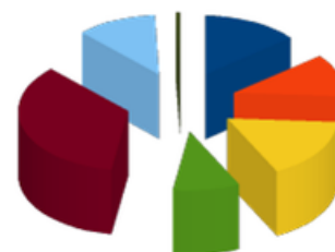
Répartition par Départements ou Pays